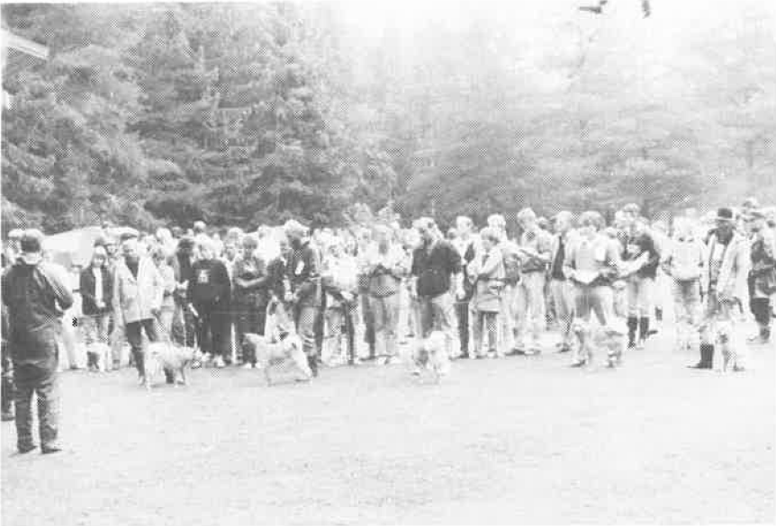
Under bedømmingen av åpen klasse tisper finsk spets.