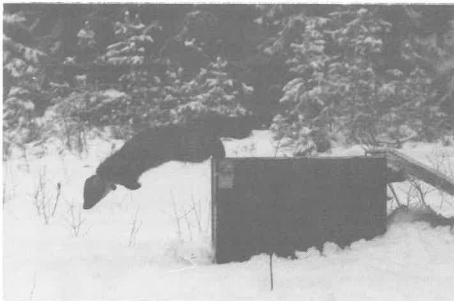
Hann-måren "Tyson" på vei ut av fella med radiosender og øremerker.