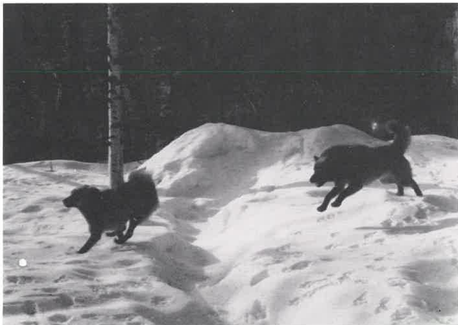
Å fly etter jentene, det er gøy det.