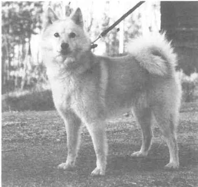
Lennek Tarja, deltager Nordisk mesterskap