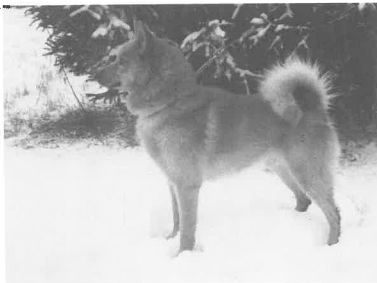
Anunds Piku, deltager Nordisk mesterskap