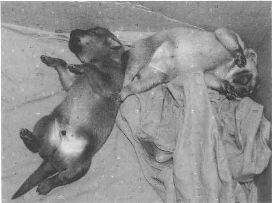
To som tar livet med ro.

Til deg som ikke er så nøye, det er ikke for sent å snu. Selvfølgelig er det ingen medlemmer av NSFN som avler bevist på individer med arvelige lidelser eller gir uriktige opplysninger ved salg av valper. Måtte i såfall kjøpsloven klå deg så det ikke frister til gjentagelse.