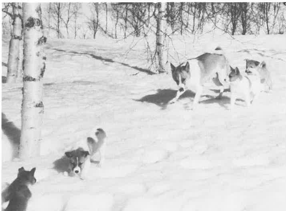
Ute og plager ho mor.