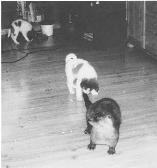
Deg skal jeg ta.

Takk for rosen av bladet. Når det gjelder jakthistoriene står den første på trykk i dette nummeret. Men skal det komme flere må noen først sende dem inn. Det er vel ikke meningen at jeg skal sitte å fabrikkere "jaktskrøner", og dessuten er jeg sikker på at det er dere flinkere til det.