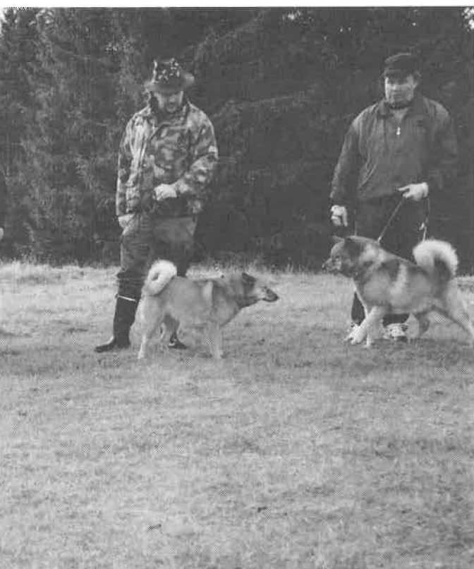
Spets Nytt nr. 4-00