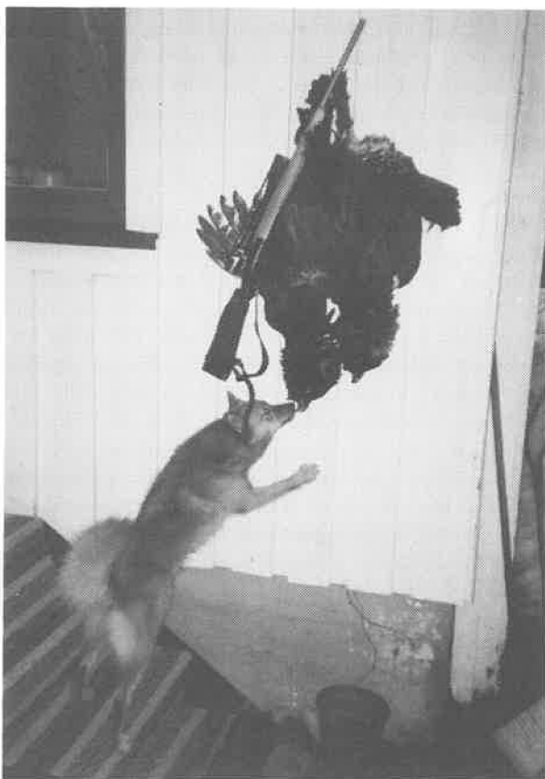
Pirri med kjempen (fuglen til venstre).

patron. Hvor mye ville fuglen tåle. På grunn av den skarpe vinkelen la jeg nå siktepunktet der det skulle være, midt på vingeknoken, og klemte av. Denne gangen fikk jeg se en ledd løs vinge som veivet forbi i okularet og forsvant. Jeg kunne ikke riktig fatte det selv ennå, men det utrolige hadde skjedd. Det var som om tiden stod stille akkurat da jeg plukket opp tom hylsene og gikk bort til den unge spetsen som fornøyd stod og tygde på sin andre tiur for dagen. Han var ikke mindre denne karen. Med snora til gamasjen knøt jeg sammen bena og hang fuglene over skuldra, en foran og en bak. Det ble ei god tung bør. Jeg kjente ingen jaktlykke da jeg gikk hjemover. Det føltes nærmest som en forbrytelse det jeg hadde gjort. Selv om jeg visste at en ny og sterkere ganske snart ville tatt den gamles plass. Selvfølgelig gledet jeg meg over hunden og jeg levde lenge på denne episoden. Uti februar/mars tok jeg meg en tur innom leiken med Pirri. Midt på spillplassen satt en tiur i ett par minutter før han rapte og dro. På tiurleiken siste uka i april var det seks verdige arvtakere som sloss om å få spredt sine gener.