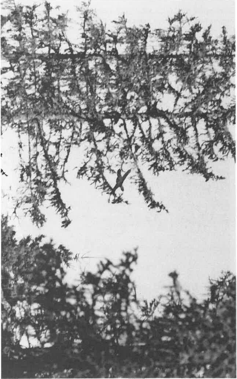
Fant du ikke fuglen? Da så du den kanskje når du støkket den?