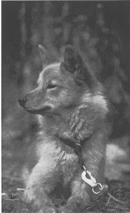
NJCH, SJCH Talvi, eier Knut Østmo