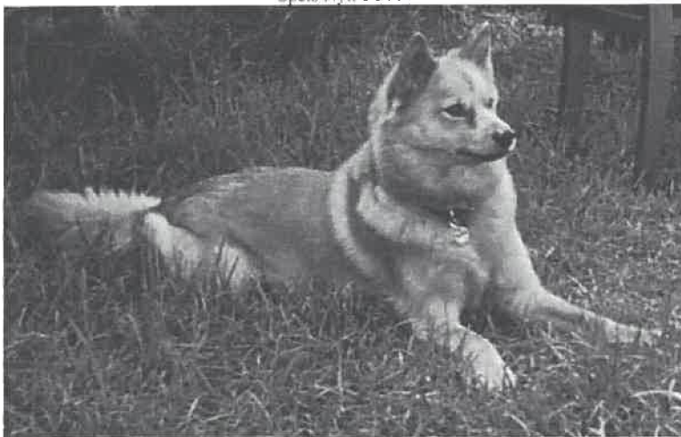
Bilde av Siirka