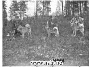
Armand t.h. med Kirvi i Nordisk.