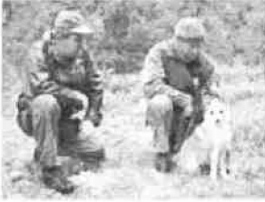
Armand t.v. som prøveleder.