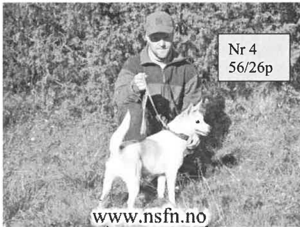
Stian Berntsen med Tiurtunet's Vesla.