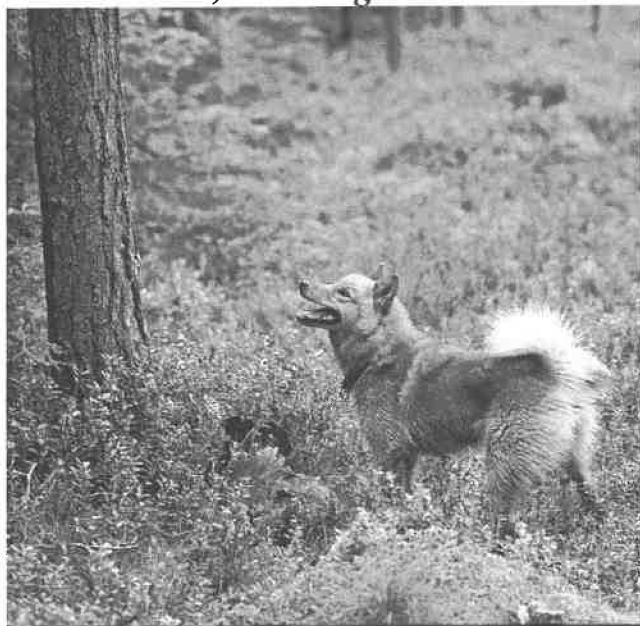
Tiukka, med sin første fugl