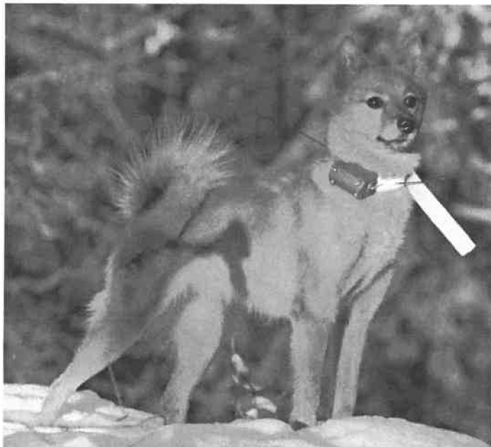
NJCH ERA

Navn: NJCH ERA 05548/02 Født: 26.01.02 Far: Røjbacken's Kirvi S28957/97 Mor: Røjbacken's Isa S53070/96