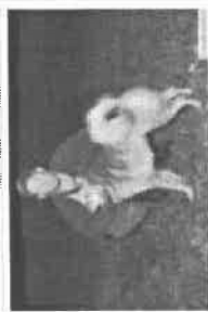
INTJCH NORJCH NUCH NM02 NOR03 NV03 Vardos Ralli, Eier Oddbjørn Nordhagen.