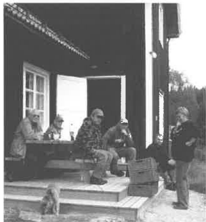
Bilde: Per Korsmo