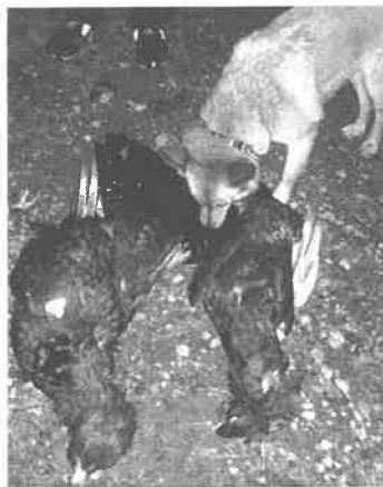
Jeni med gammeltiur fra første jaktuka i høst.