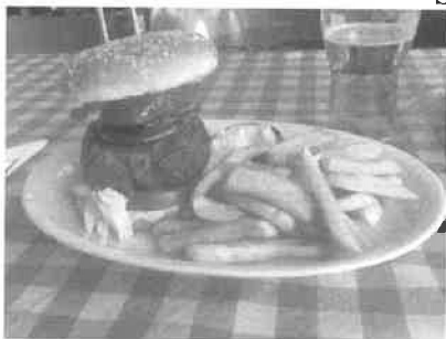
Kan anbefales på det varmeste.