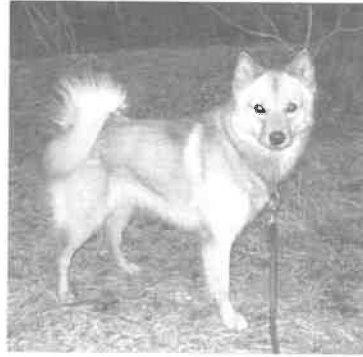
Sikke til Bernt Enge-Larsen