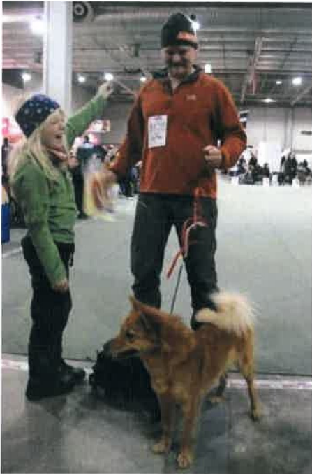
BIR 07725/08 Fort Hjort Pirkko Eier: Jens Torp