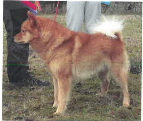
Kiro 23298/05 Cert 1. BHK BIR 1 BIG