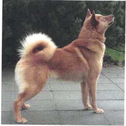
Jiällän Inka FIN 25836/08 Cert 1.BTK