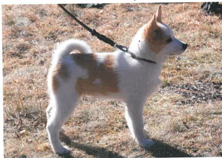
NOBS VALP FRA KENNEL GB