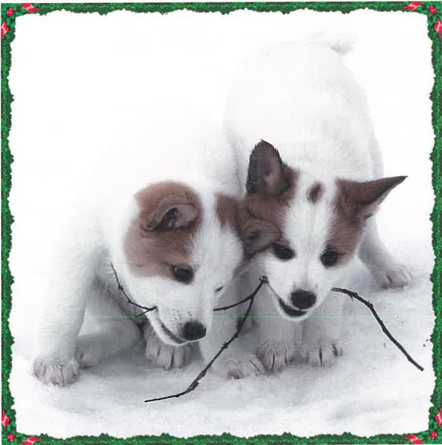
Sippas valper 2012