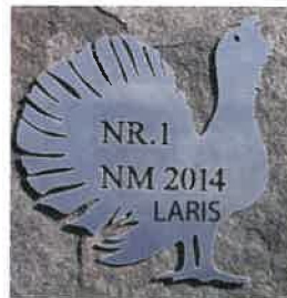
Nr. 1 og norsk mester for halsende fuglehunder 2014, Oddbjørn Nordhagen og Laris. 87 poeng