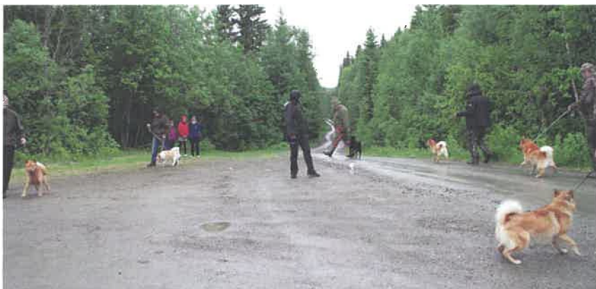
Ringtrening er en av aktivitetene på spetstreffet på Langvassheimen. Her fra et tidligere treff.