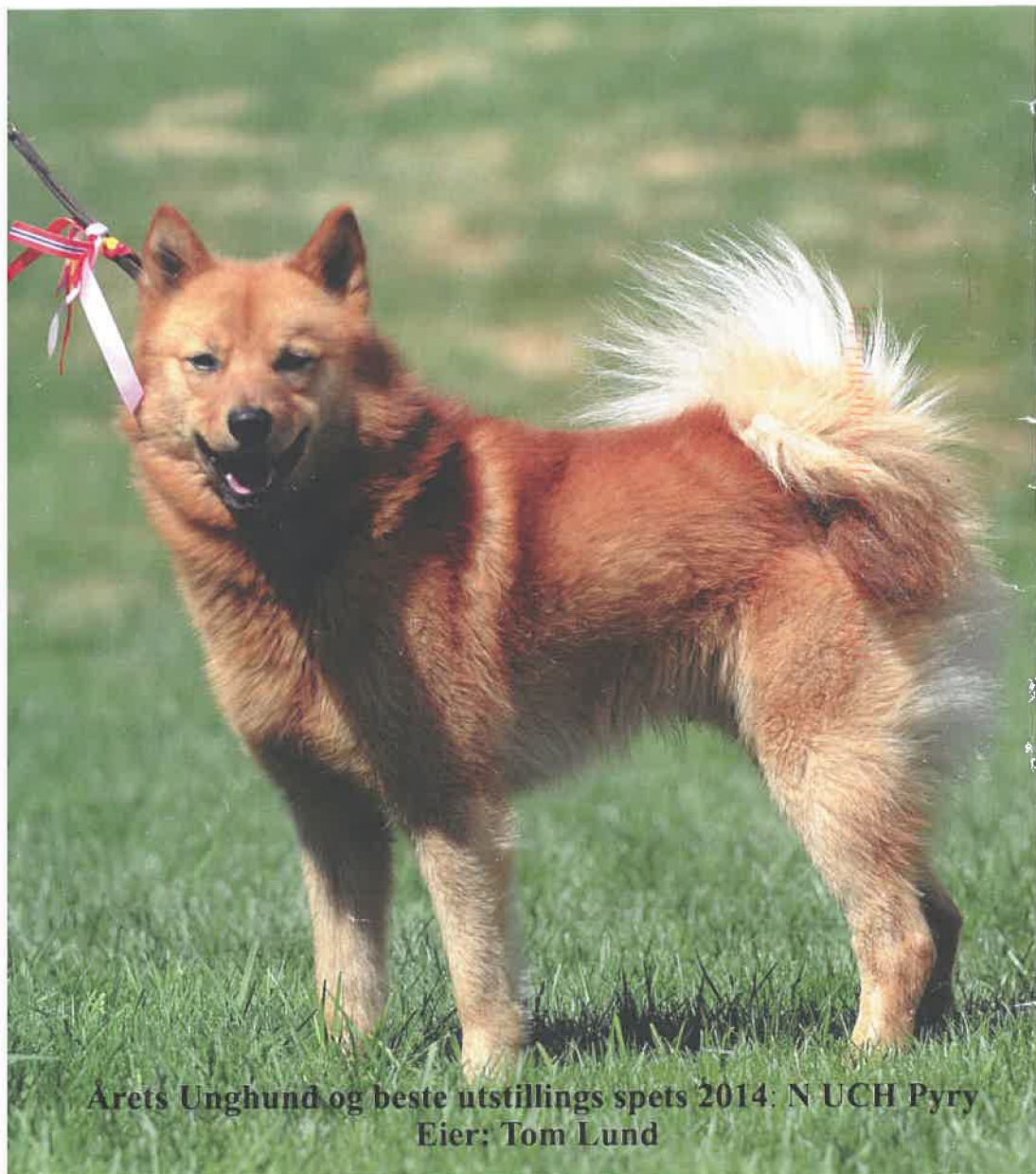
Arets Unghund og beste utstillings spets 2014: N UCH Pyry Eier: Tom Lund